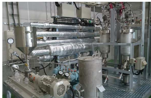
連続式パイロット機