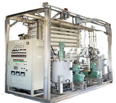
量産設備の設計・製作