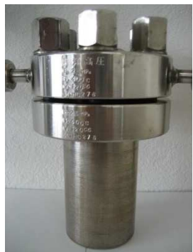
小型オートクレーブ