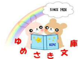
「ゆめさき文庫」ロゴマーク